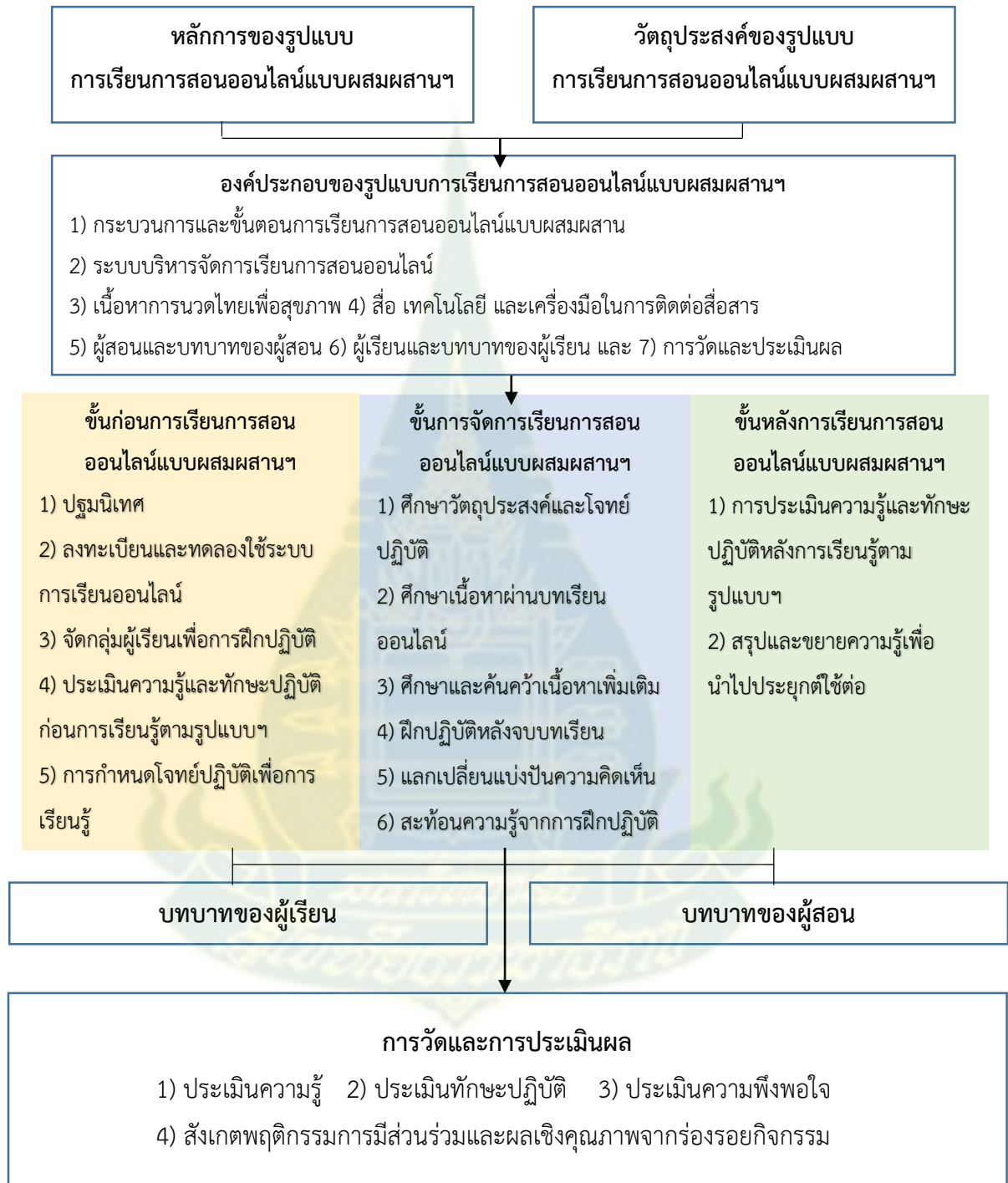
ภาพที่ 5.1 กรอบแนวคิดรูปแบบการเรียนการสอนออนไลน์แบบผสมผสาน เพื่อส่งเสริมอาชีพการนวดไทยเพื่อสุขภาพสำหรับนักศึกษาผู้ใหญ่

กรอบแนวคิดของรูปแบบการเรียนการสอนออนไลน์แบบผสมผสานเพื่อส่งเสริมอาชีพการ นวดไทยเพื่อสุขภาพสำหรับนักศึกษาผู้ใหญ่ รายละเอียดดังภาพที่แสดง