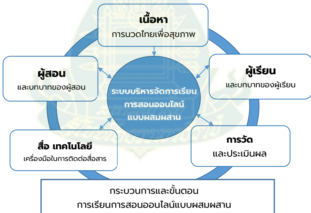
ภาพที่ 5.2 องค์ประกอบรูปแบบการเรียนการสอนออนไลน์แบบผสมผสาน เพื่อส่งเสริมอาชีพการนวดไทยเพื่อสุขภาพสำหรับนักศึกษาผู้ใหญ่

1. องค์ประกอบรูปแบบการเรียนการสอนออนไลน์แบบผสมผสานเพื่อส่งเสริมอาชีพการนวดไทยเพื่อสุขภาพสำหรับนักศึกษาผู้ใหญ่